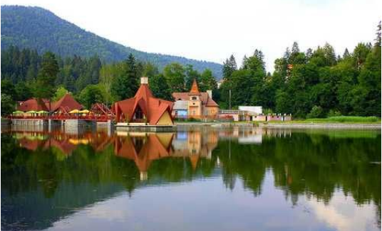
17.00-17.00 óráig Szent Anna tó és Mohos Láp megtekintése könnyű sétával.