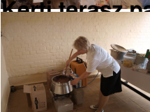
A Klubnap résztvevői