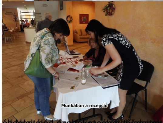
Munkában a recepció